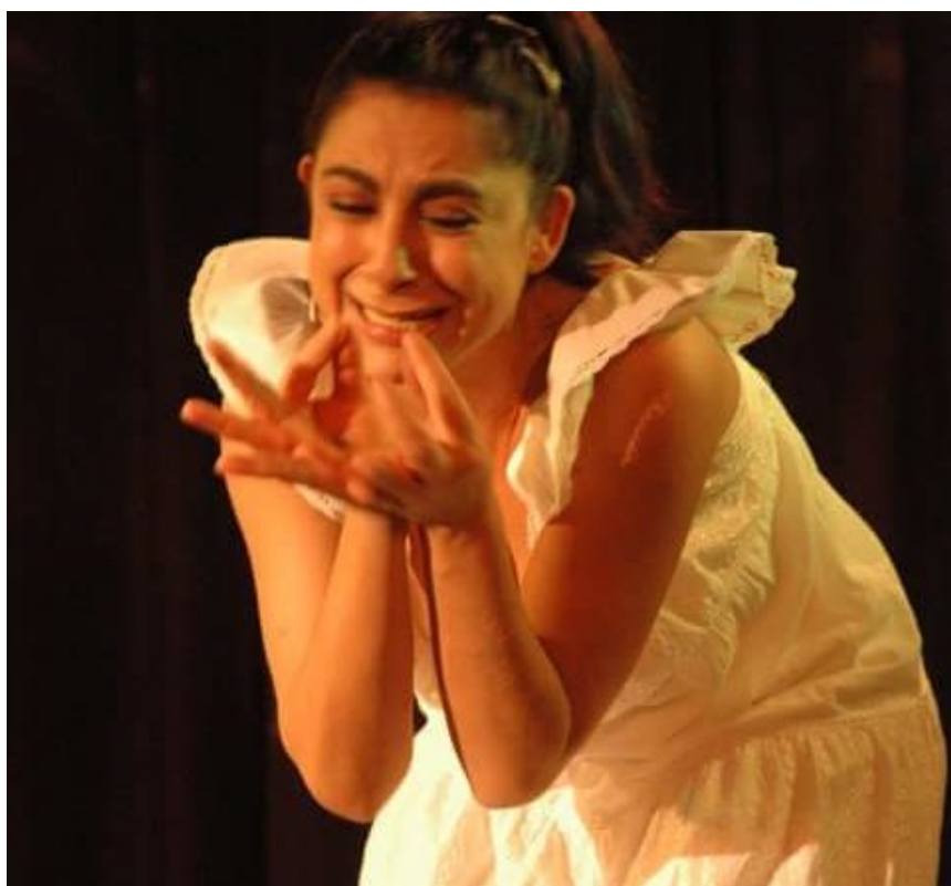
"Marmore Rafting" di Valentina Franci