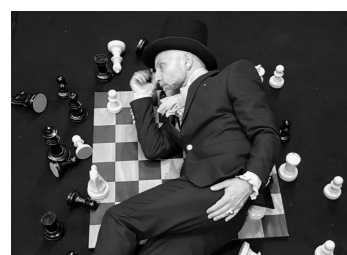
Tinaos e Casa del